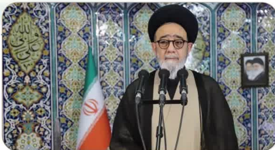
خطبه های عبادی سیاسی نماز جمعه تبریز ۲۵ فروردین ماه