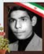
عابدین رضوی خرم استاندار آذربایجان شرقی